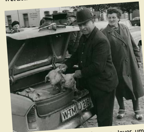
Ferkelverkauf aus dem Kofferraum, Jever, um 1970, Franz Tuhy, Schlossmuseum Jever

Es ist auch ein Partizipationsprojekt mit Jugendlichen mit einem Fotowettbewerb und begleitenden Workshops geplant. In Zusammenarbeit mit den lokalen Schulen soll so die Medienkompetenz gestärkt werden und das Bildarchiv mit dem aktuellen Blick einer bisher unterrepräsentierten Altersgruppe auf ihre Region ergänzt werden.